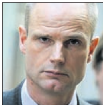
Sr. Stef Blok

DEN HAAG – Partidonan di coalicion VVD y CDA ta spera riba cooperacion di e fraccionnan di oposicion awor cu PVV y Geert Wilders a retira su sosten como partido tolerante. Aunke cu e situacion politico ta mas cu sigur resulta den eleccionnan nobo, e gabinete lo tin cu keda cla cu e presupuesto pa 2013 y presenta esaki na Bruselas pa wak si e ta cuadra cu norma di Union Europeo.